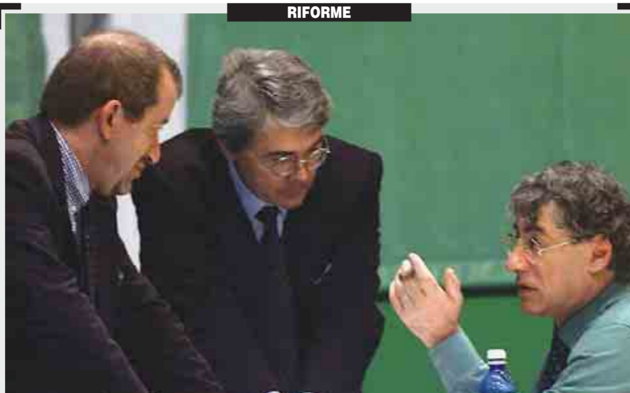
RIFORME Bossi migliora e torna a guidare la Lega Vertice a Gemonio con i «colonnelli»

Umberto Bossi migliora: dopo la vittoria sulla devolution torna a guidare la Lega. Ieri vertice a Gemonio con i ministri Calderoli, Maroni e Castelli.